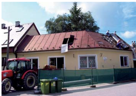
Obecný úrad – stav pred rekonštrukciou.

Budova dnešného obecného úradu bola postavená v dvadsiatych rokoch minulého storočia ako rodinný dom. Postupne, ako sa menil účel jej využitia, bola stavebne upravovaná. Po roku 1948 sa v nej usídlil miestny národný výbor a odvtedy slúži ako administratívna budova dodnes. V roku 1991 po osamostatnení našej obce od mesta Žiliny, tu bol umiestnený