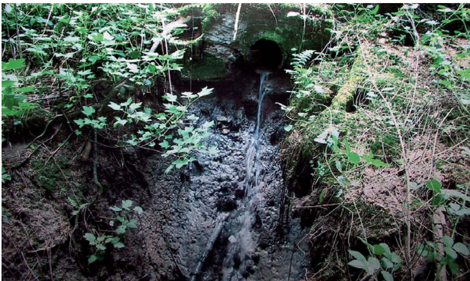
Splašky vypúšťané do voľnej prírody – stav pretrváva už roky.

„Akceptujeme Vašu ponuku...“, „V rámci investorskej činnosti, ktorú na seba preberáte -aktualizovať všetky písomnosti potrebné k vydaniu kolaudačného rozhodnutia na nedokončenú investíciu...“, „Po vybavení vyššie uvedených náležitosti a predložení platných písomnosti pristúpime k riešeniu financovania stavby formou združenej investície“. Obec ako sľúbila práce do 30. 06. 2009 na kanalizačnej stoke urobila, opravila ju, stavbu skolaudovala a obrátila sa ako so samozrejmosťou na ŽSK o úhradu nákladov. Náklady dosiahli 2 937 215, 71 Sk (97 497,70 €), teda podstatne nižšie než plánoval ŽSK na vybudovanie ČOV. Faktúra bola doručená na ŽSK dňa 20.07.2009 a hneď na druhý deň sme obdržali list a vrátenú faktúru (toho istého pracovníka ŽSK, ktorý súhlasil s realizáciou prác), v ktorom sa hovorí, že zo strany ŽSK „nebola uzatvorená zmluva o dielo a tiež žiadna iná dohoda či už ústna alebo písomná o rozsahu stavebných prác a ich následnej fakturácii na kanalizačnom zberači DSS pre dospelých Straník“. Musíme