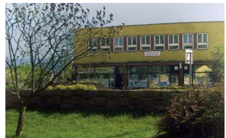
Zdravotné stredisko v minulosti.

S rekonštrukciou budovy sa započalo ešte v roku 2008 a to výmenou okien, rekonštrukciou kotolne a výmenou ústredného kúrenia. Na prízemí boli vytvorené