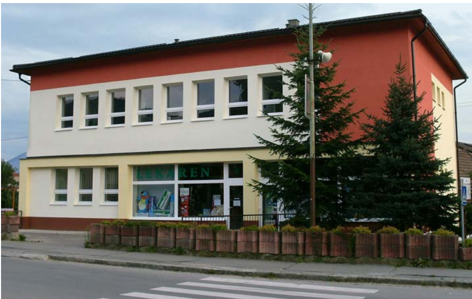
Budova zdravotného strediska po prestavbe.