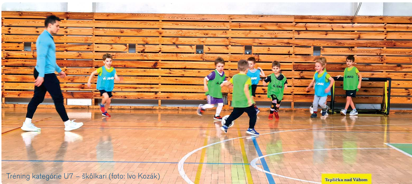
Tréning kategórie U7 – škôlkari