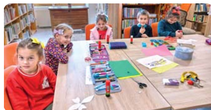
Deti si výrobu vianočných ozdôb veľmi užívali (vľavo papierové mašle, vpravo snehové vločky).

Adventné obdobie je spájané s prípravou na Vianoce. Aj v knižnici sme sa pri-