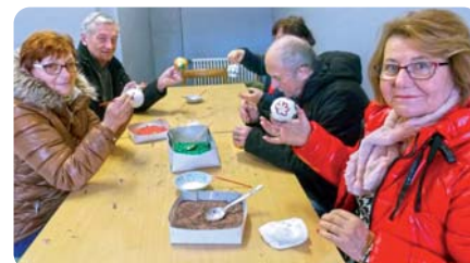
Okrasa Čadca ponúka možnosť vyskúšať si ručne ozdobiť sklenené gule.