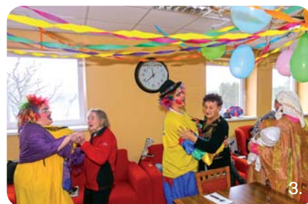
1. Spoločná fotografia fašiangových masiek 2., 3. Smiech, tanec, zábava s obyvateľmi Domova pokoja Žofie Bosniakovej 4. Sprievod fašiangových masiek ulicami obce

i pečenou klobásou. Po privítaní chlebkom s prazenicou odštartoval DJ program s prevažne ľudovou hudbou, na ktorú plynule nadviazalo trio hudobníkov so živou hudbou. Ďalej sa parket plnil účastníkmi zábavy vlniacimi sa do rytmu starších i novších hitov. Fašiangová veselica opäť potvrdila, že si vie prísť na svoje viac generácií. Pohľad na nové variácie skupiniek a plné stoly zabávajúcích len potvrdil, že akcia splnila účel – zabaviť sa a bližšie sa spoznať s ľuďmi zo svojej obce.