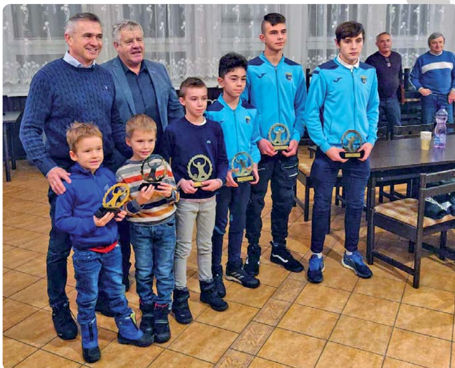
Odovzdanie cien pre najlepších hráčov počas Valného zhromaždenia OFK