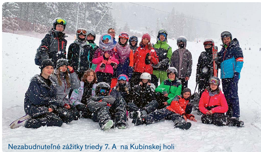
Nezabudnuteľné zážitky triedy 7. A na Kubínskej holi