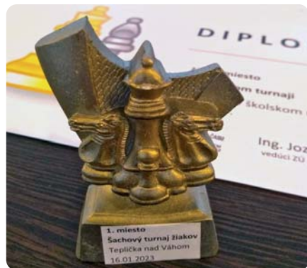
1. miesto Šachový turnaj žiakov Teplička nad Váhom 16.01.2023