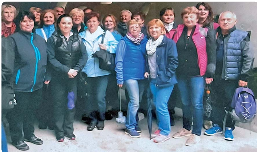
Hore – výlet na Moravu do jaskyne Macocha (2017), dole – Vansovej Lomnička (2016)