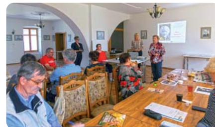
Na prednáške „Ako nebyť okradnutý“ si dôchodcovia zopakovali Desatoro bezpečného seniora.

„RADUJME SA, KEDYKOL'VEK MÁME PRÍLEŽITOSŤ. SMEJME SA A UŽÍVAJME SI VECI, KTORÉ NÁS ROBIA ŠTASTNÝMI. ŽIME V SÚČASNOSTI, PRETOŽE PRÍTOMNOSŤ JE JEDINÝ OKAMIH, KTORÝ NÁM PATRÍ.“