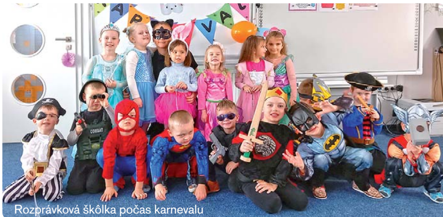
Rozprávková škôlka počas karnevalu

Celá škôlka sa premenila na rozprávku. Počas karnevalu sa deti premenili na obľúbených hrdinov i princezné. Zavítal medzi nás aj vlčík, kozmonaut, semafor či dráčik, ktorí si užívali čas veselosti, hudby a zábavy.