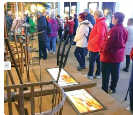
Naprieč históriou Slovenského národného múzea v Martine návštevníkov sprevádzala lektorka.