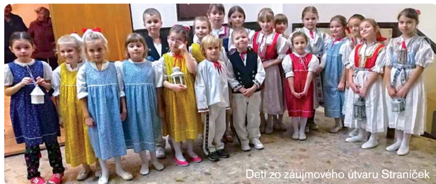
Deti zo záujmového útvaru Straniček

CENTRUM VOLNÉHO ČASU V TEPLIČKE NAD VÁHOM PRE DETI A MLÁDEŽ PONÚKA RÔZNE ZÁJMOVÉ ÚTVARY. CHLAPCI A DIEVČATÁ SI SVOJE ZRUČNOSTI OVERUJÚ S ROVESNÍKMI V RÔZNYCH SÚŤAŽIACH ALEBO SA PREDSTAVUJÚ VEREJNOSTI S NACVIČENÝM PROGRAMOM.