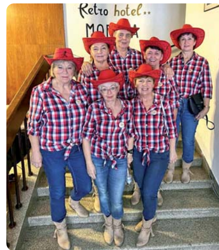
Babky šikulky ako účastníčky súťaže „Seniory tancujú country Tatrám“