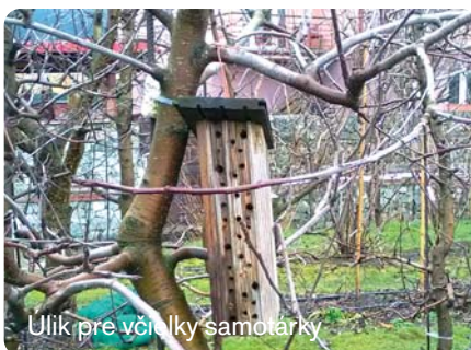
Ujik pre včielky samotárky