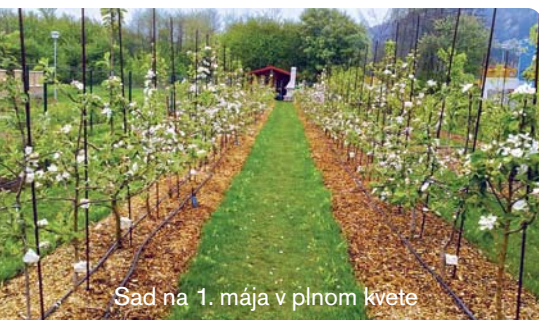
Sad na 1. mája v plnom kvete

Zo stromov opadáva na prelome jari a leta veľké množstvo nedozretých plodov, tzv.