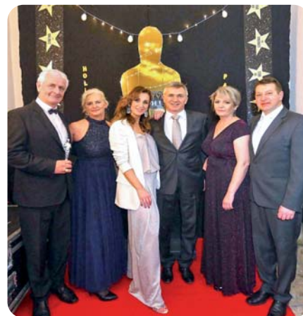
Hore – 11. ročník Benefičného plesu v štýle udeľovania filmových Oscarov