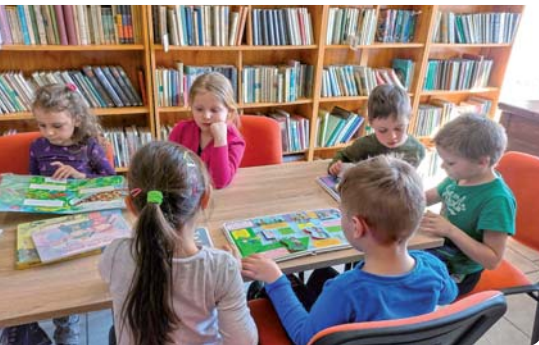
Listovanie v knižkách s otváracími okienkami

OBEČNÁ KNIŽNICA PRE SVOJICH ČITATEĽOV A NÁVŠTEVNÍKOV PRICHYSTALA V MINULOM ROKU RÔZNE AKTIVITY. ČI UŽ TO BOLI PODUJATIA PRE DETI, ALEBO STRETNUTIA SO SPISOVATEĽOM PRE DOSPELÝCH. PRIPOMEŇME SI ASPOŇ NIEKTORÉ.