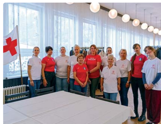
Organizátorky dobročinnnej akcie SWAP