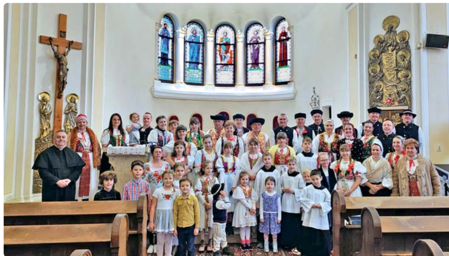
Spoločná fotografia v Kostole sv. Martina

TRADIČNÉ HODY NA SV. MARTINA SA KONAJÚ PRI PRÍLEŽITOSTI ZASVÄTENIA KOSTOLA V TEPLIČKE NAD VÁHOM SV. MARTINOVÍ BISKUPOVI Z TOURS.