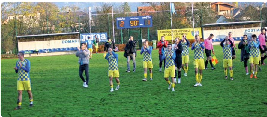
Hráči A v novembrovom zápase s Turzovkou

V náročných ekonomických časoch je fungovanie klubu v uvedenej hráčskej základni finančne náročné a bez sponzorov nemožné. Výbor klubu touto cestou ďakuje predstaviteľom Obecného úradu za veľkú pomoc v tomto smere. Členovia OFK stále hľadajú ďalších sponzorov, vďaka ktorým by mohli klubovú činnosť skvalitňovať. Vytvárajú aj vlastné aktivity na získanie dostatočného množstva financií. Organizovali Futbalovú veselicu v Rybníku a na Slávnostiach Matky Božej, Svätomartinského jarmoku aj počas Adventného punčovania mohli návštevníci prispieť v stánku OFK. Všetkým, ktorí touto cestou podporili rozvoj futbalu v Tepličke, vedenie klubu ďakuje.