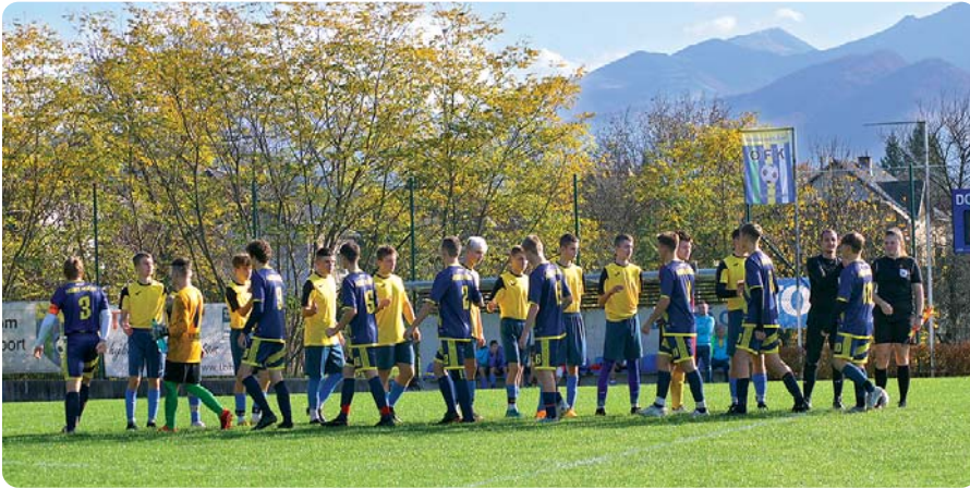
Dorast v zápase s Horným Hričovom