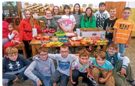
Malá ochutnávka jablkových dobrôt, ktoré pripravili žiaci 5.A triedy

koláčov, odšťavovali a sušili jablká, varili punč a na hodinách techniky pripravili rôzne nátierky a šaláty s jablkami. Jablkovo posilnení súťažili o najdlhšiu jablkovú šupku a najkrajšie jablko.