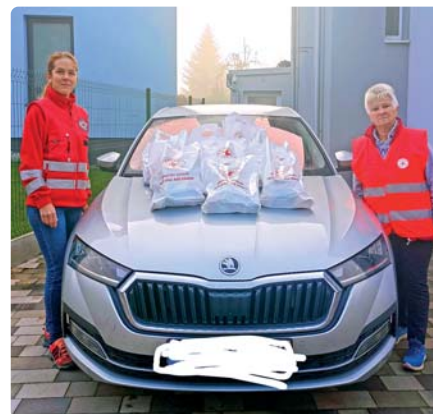
Vitamíny a potraviny odovzdali starým občanom členky MsSČK osobne.