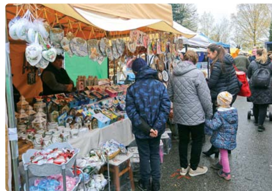
Nejedného okoloidúceho zaujali ručne vyrábané výrobky.