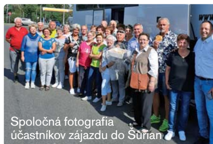
Spoločná fotografia účastníkov zájazdu do Šuran