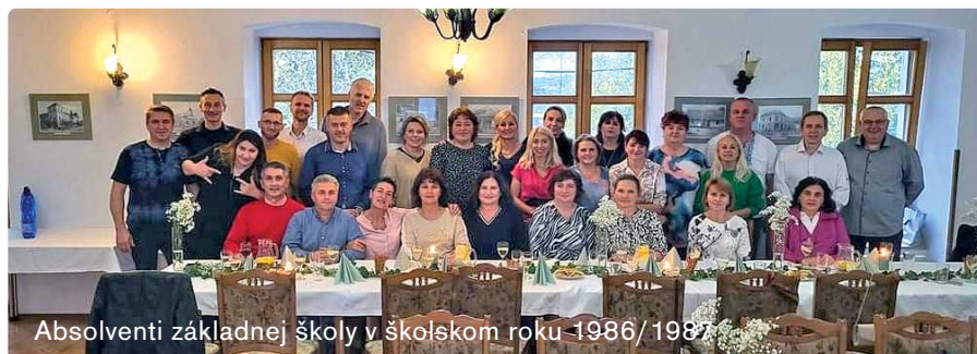
Absolventi základnej školy v školskom roku 1986/1987

TEXT: Mgr. Natália Hogajová