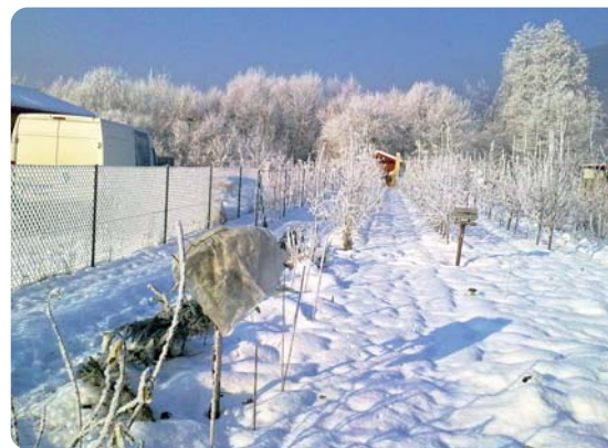
Zimné zátiešie s krmítkom na hliníkovom stĺpe

Je dostatok času na kontrolu zásoby ochranných prostriedkov a hnojív, stavu náradia, strojov a všetkých potrebných pomôcok. Ostria sa štepárske nože, nožnice a pilky. V tomto čase sa dá urobiť sanitárny postrek všetkých ovocných drevín Sulkou.