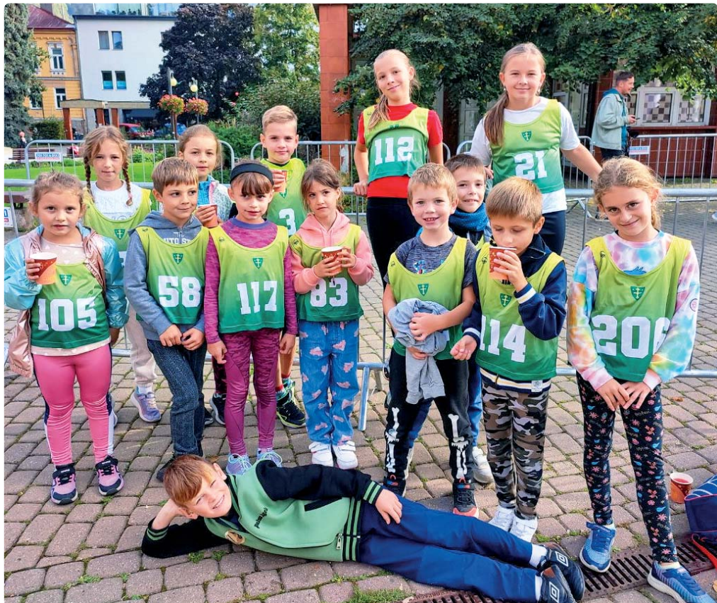
Reprezentanti našej školy na pretekoch Beh pre najmenších