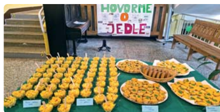
Chutné nátierky a šaláty s jablkami

Cieľom viacerých októbrových aktivít bolo upevňovať správne stravovacie návyky u našich žiakov, poznať hodnotu domácich potravín a hlavne hodnotu vlastného zdravia. Výživové aktivity začali pri príležitosti Svetového dňa výživy a vyvrcholili Jablko-braním. Súčasťou zážitkového vyučovania boli akcie: Hovorme o jedle, Týždeň zdravej výživy, Deň jablka, Viem, čo jem. Žiaci vytvárali plagáty, prezentovali projekty, skladali básne. Zapojili sa aj do výtvarnej, fotografickej i literárnej súťaže. Zážitkové bolo nielen vyučovanie, ale aj ochutnávanie, ktoré potešilo nejedného milovníka jedla. Školáci priniesli neuveriteľné množstvo jablkových