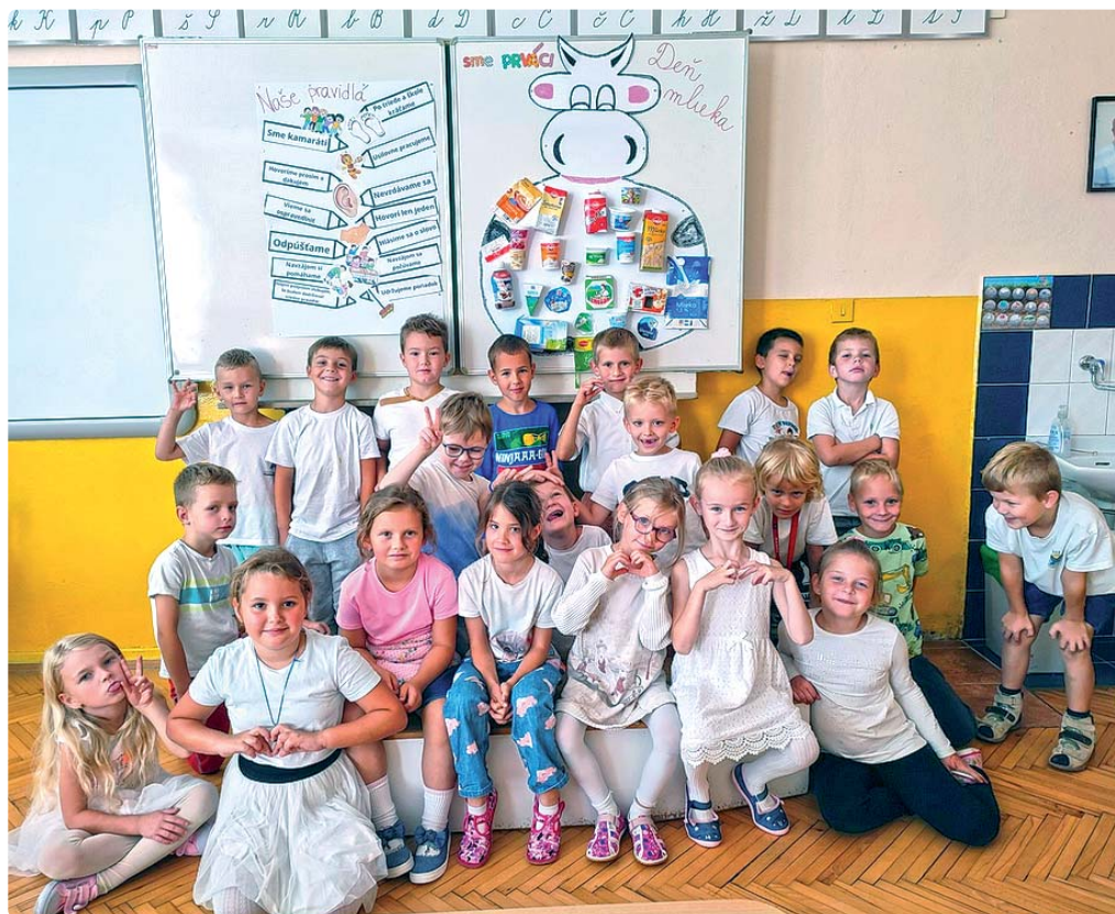
Prváci predstavili projekt vrámci Svetového dňa mlieka.

Každoročne sa naša škola zapája do rôznych projektov ( Svetový deň mlieka , Európsky deň jazy-