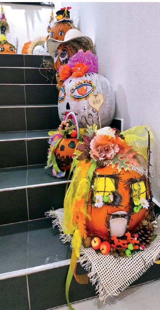
Kreativita žiakov počas Tekvičkového dňa