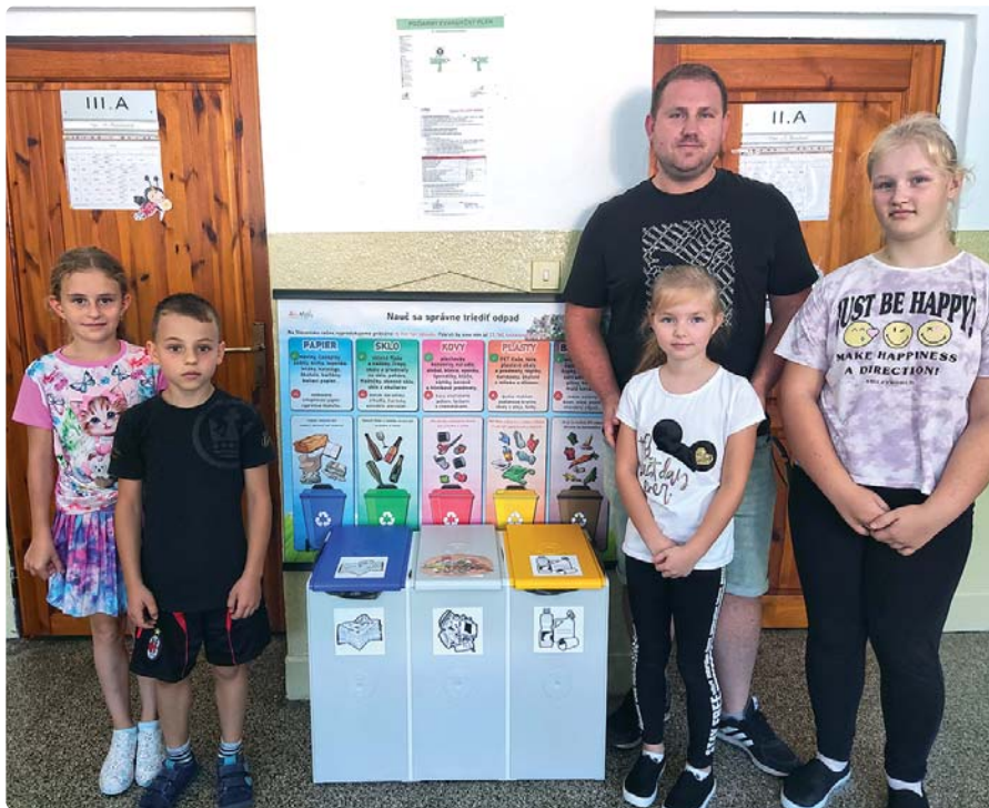
V priestoroch školy sú vybudované nádoby na separovaný odpad.

Žiaci sa už od začiatku školského roka zúčastnili niekoľkých vedomostných súťaží, kde potvrdili svoje vedomosti. Každoročne sa