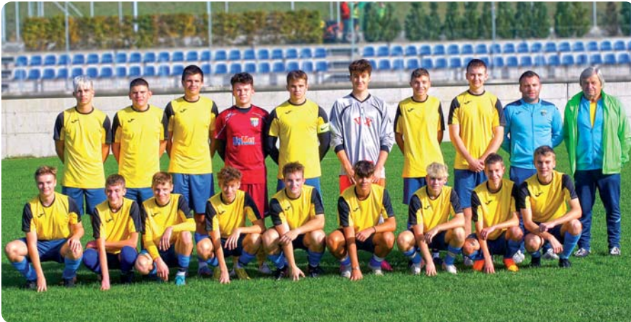
Mužstvo kategórie U19

7. októbra na hlavnom ihrisku v Tepličke nad Váhom. Išlo o vydarenú akciu, ktorej sa zúčastnilo viac ako 200 detí z okolia. Samozrejme zápasy odohrali kluboví hráči z prípraviek U7, U9 a U11.