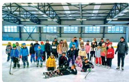
Korčuľari na zimnom štadióne v Žiline