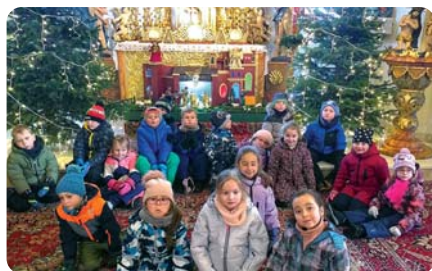
Podakovanie za darčeky pri jasličkách