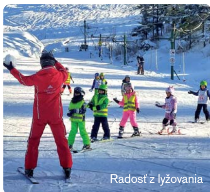
Radosť z lyžovania