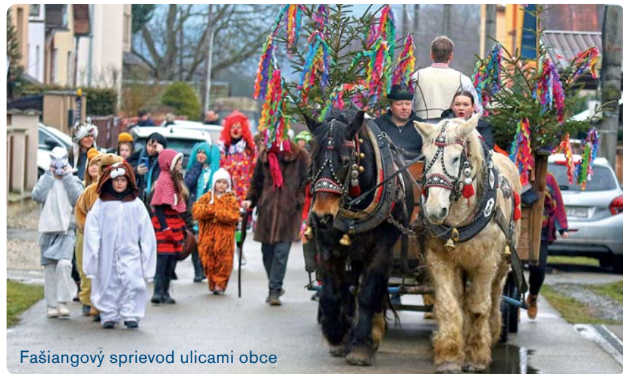
Fašiangový sprievod ulicami obce

TOHTOROČNÉ FAŠIANGOVÉ OSLAVY V TEPLIČKE NAD VÁHOM SA NIESLI NIELEN V ZNAMENÍ TRADÍCIÍ, ALE AJ SPOLUPATRIČNOSTI, RADOSTI A ĽUDSKEJ BLÍZKOSTI. PESTROFARBENÉ MASKY ZAPLNILI ULICE A DOBRÁ NÁLADA SPREVÁDZALA SPRIEVOD OD PRVÝCH KROKOV AŽ PO SPOLOČNÉ STRETNUTIE NA NÁMESTÍ SV. FLORIÁNA.