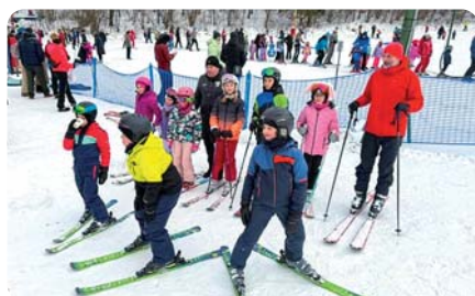
Lyžovačka vo Vrátnej