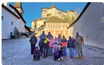
Na Oravskom hrade