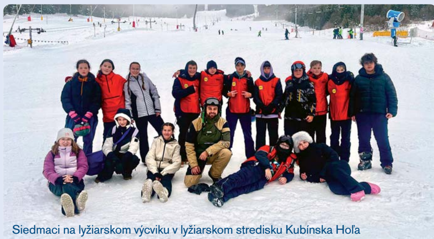
Siedmáci na lyžiarskom výcviku v lyžiarskom stredisku Kubínska Hoľa