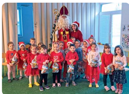
Sv. Mikuláš potešil aj škôlkarov.

TEXT: Mgr. Marianna Martinkovič