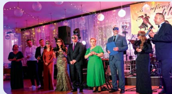
Slávnostné zahájenie Benefičného plesu 2026

Organizátori ďakujú všetkým, ktorí sa podieľali na príprave plesu. Vďaka sponzorom a najmä hostom sa opäť potvrdilo, že Teplička nad Váhom je obcou, kde solidarita a ochota pomáhať majú pevné miesto.