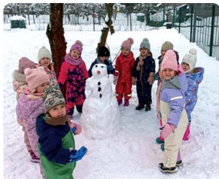
Kto to prišiel medzi nás? No predsa kamarát – snehuliak.