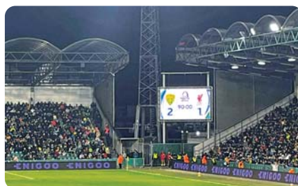
Návšteva zápasu MŠK Žilina – FC Liverpool