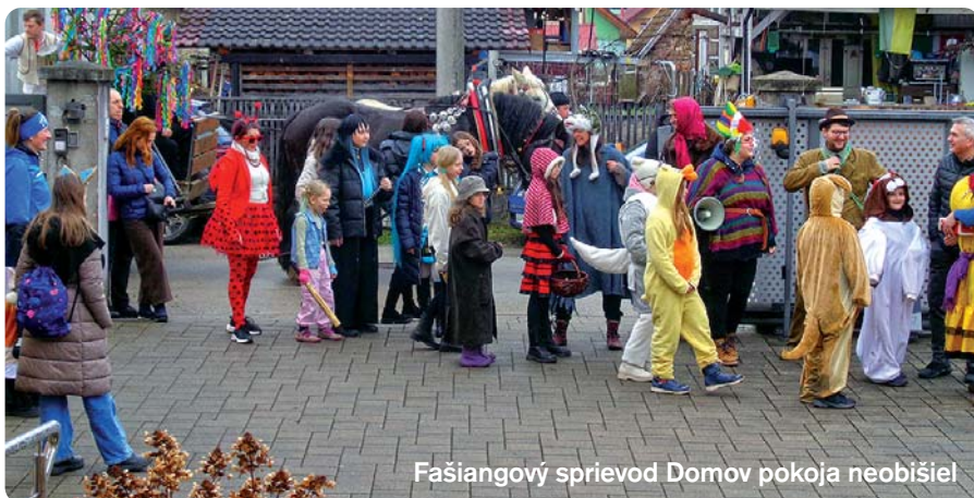
Fašiangový sprievod Domov pokoja neobišiel