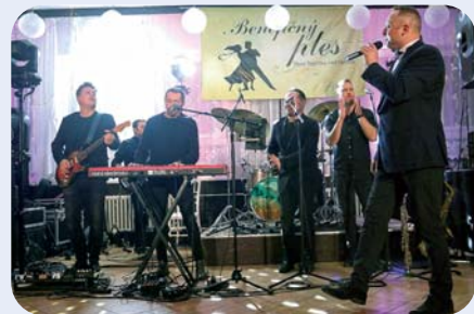
All Stars Band