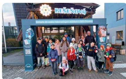
Návšteva termálneho parku