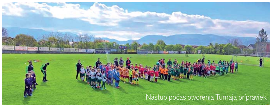
Nástup počas otvorenia Turnaja prípraviek