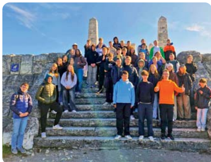
Exkurzia – Mohyla M. R. Štefánika na Bradle

Veľkosť osobnosti a majestátnosť mohyly žiakov uchvátila natoľko, že na exkurziu nikdy nezabudnú.