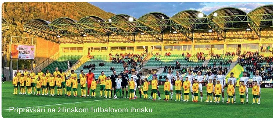
Prípravkári na žilinskom futbalovom ihrisku

V rámci projektového dňa JEDLOBRANIE, ktorého cieľom je budovanie povedomia o zdravom životnom štýle, sa žiaci zapojili do súťažno-vzdelávacích aktivít „Hovoríme o jedle“ a „Viem, čo zjem“. Deň začal ranným kruhom a s pani učiteľkami si spoločne pripravili zdravé chutné raňajky v podobe nátierok, ovocných a zeleninových mís. Rôznymi kvízmi, prezentáciami, projektmi a inými aktivitami si zopakovali, ako sa správne stravovať, aká strava je vhodná pre správny vývin. Projektový deň sme ukončili ochutnávkou nátierok z tuniaka, avokáda a syra, ktoré pre všetkých pripravili pani