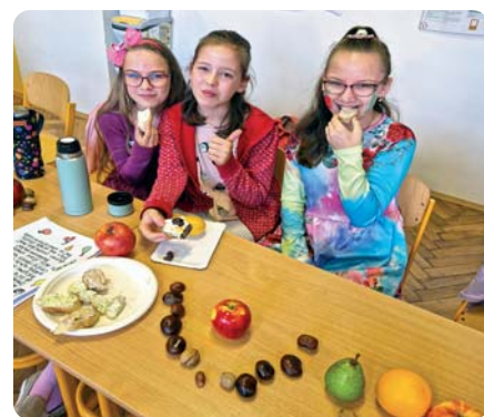
Ochutnávanie dobrôt ≙ Šalát alebo odstavená ovocná šťava? ≙

AUTOBUSOM NA ĽAD IDE DRUHÁK ŠPORTOVEC, KORČUĽOVANIE JE DOBRÁ VEC!