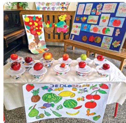
Súťaž o najkrajšie jablčko