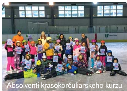
Absolventi krasokorčuliarskeho kurzu