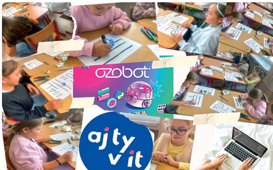
Práca s ozobotmi

Každý deň priniesol nové zážitky, ktoré žiakov motivujú k ďalšiemu rozvoju. Či už išlo o tvorivé dielne, športové výkony alebo technické výzvy, naši žiaci preukázali nadšenie, talent a chuť spoznávať nové veci.