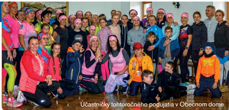
Účastníčky tohtoročného podujatia v Obecnom dome

S príchodom jesene sa schýľuje k súťaženiu žien na bežeckej trati. Populárny JESENNÝ BEH pre ŽENY sa tento rok konal 13. októbra 2024. Organizátorky a účastníčky neodradilo ani upršané typické jesenné počasie, ktoré už tradične sprevádza bežkyne. Napriek tomu sa v nedeľu na námestí stretol rekordný počet odhodlaných žien. Tento rok sa zúčastnilo 51 pretekárk, z čoho bolo 9 dievčat v detskom veku a 27 účastníčok z obce Nededza a Teplička nad Váhom. Sily si merali na bezpečnej cyklotrase cez otočňu v Nededzi so štartom a cieľom v Tepličke na námestí. Po behu bolo pripravené občerstvenie