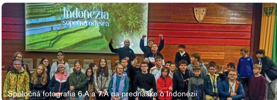
Spoločná fotografia 6.A a 7.A na prednáške o Indonézii