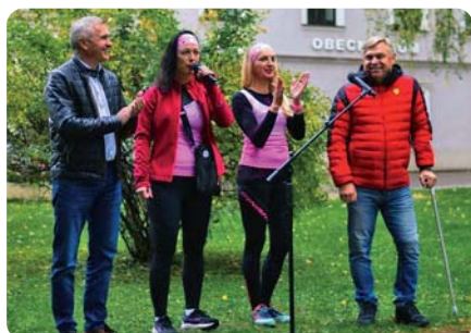
Organizátorky Jesenného behu žien so starostami štartovacej a cieľovej obce