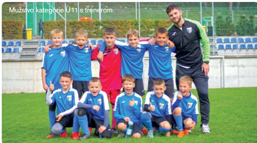
Mužstvo kategórie U11 s trénerom

FUTBALOVÝ KLUB OFK TEPLIČKA NAD VÁHOM ZAŽÍVA OBDOBIE ROZKvetu, NAJMĀ VĎAKA VÝRAZNÉMU ZÁJMU O PRÍPRAVNÉ KATEGÓRIE. TÍM TRÉNEROV A FUNKCIONÁROV PRACUJE NA TOM, ABY VYCHOVAL NOVÚ GENERÁCIU TALENTOVANÝCH FUTBALISTOV A UDRŽAL SI POZÍCIU NAJAKTÍVNEJŠIEHO ŠPORTOVÉHO KLUBU V OBCI.