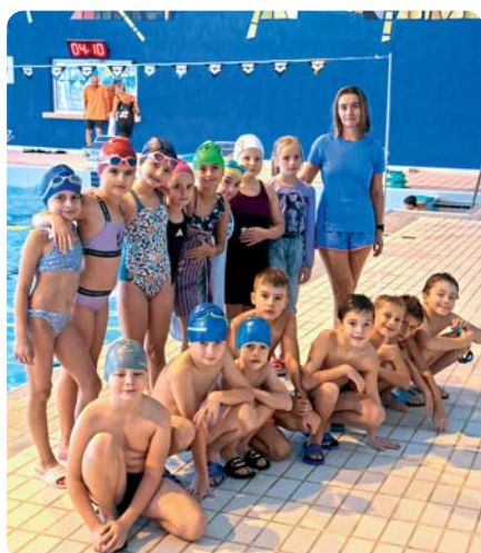
Plavecký výcvik tretiaakov

TEXT: kolektív ZŠ Ž. Bosniakovej