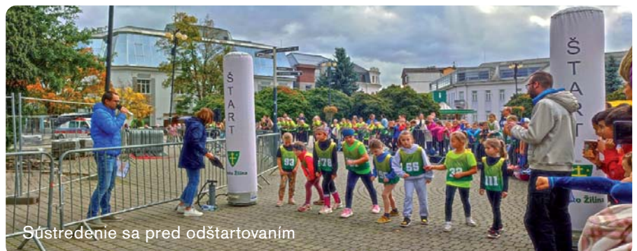
Sústredenie sa pred odštartovaním