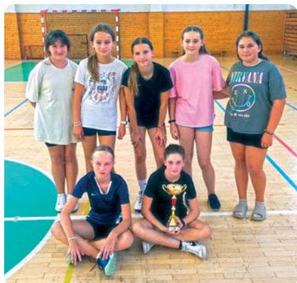
Obhájenie prvenstva, Florbalový turnaj dievčat zo 7. A